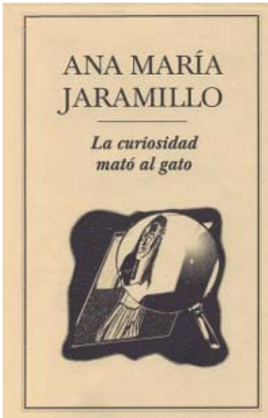
La curiosidad mató al gato . México : Ediciones El Ermitaño, 1996.