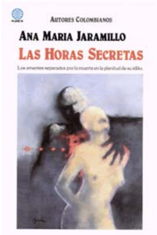
Las horas secretas. Bogotá : Editorial Planeta, 1990.